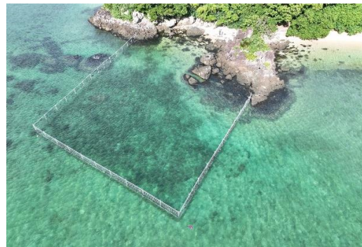
<防護柵を設置した保全エリア>